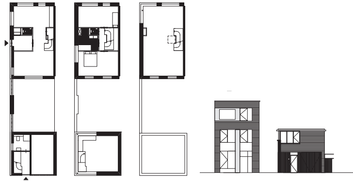
begane grond, eerste en tweede verdieping en gevel